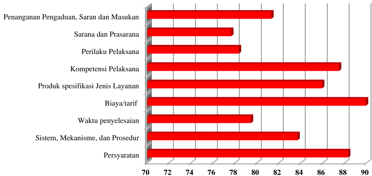
Gambar 2. Grafik Nilai SKM per Unsur Pelayanan